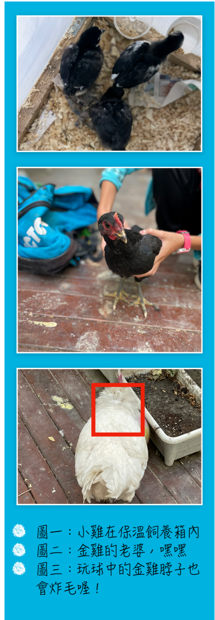
❁ 圖一：小雞在保溫飼養箱內 ❁ 圖二：金雞的老婆，嘿嘿 ❁ 圖三：玩球中的金雞脖子也會炸毛喔！