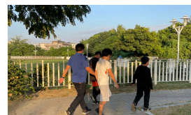
馬拉松練習 大家一起來跑步